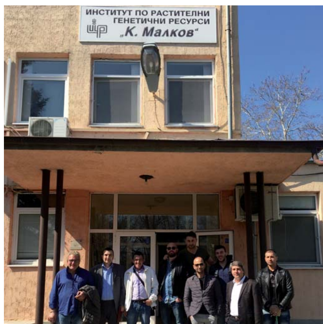
Delegazione Unsic presso l'Istituto per le Risorse Genetiche Vegetali 'K. Malkov'

Maggiori informazioni al sito web: www.unsicbulgaria.com