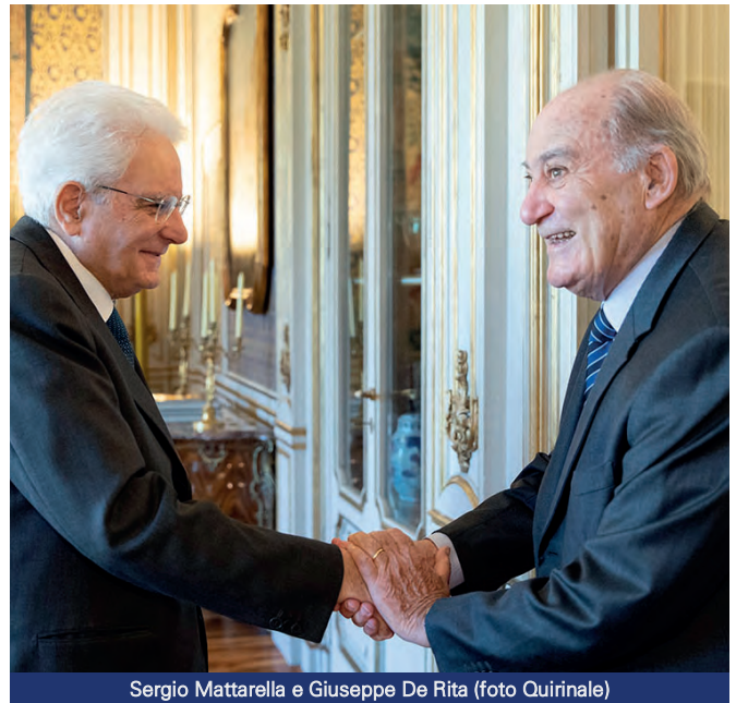
Sergio Mattarella e Giuseppe De Rita

De Rita conferma le sue critiche al ruolo della borghesia, “ridotta al padroneggiamento e alla sintesi dei processi in atto”, incapace di movimentare la realtà: sul banco degli imputati c'è pure la “cetomedizzazione”, che pur essendo uno dei fenomeni di maggiore ascesa sociale dal dopoguerra con il noto “ascensore sociale” (che ha nello studioso senza dubbio il più lucido esaminatore), non è riuscita a far nascere una moderna classe borghese in Italia. La riprova è l'affermazione del populismo, visto come attaccamento piccolo borghese al circo-